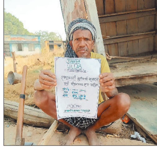
साक्षरता में काम करने वाले लोग घर-घर पहुंचे और उनको निमंत्रण दिया। कहा गया आज उल्लास परीक्षा