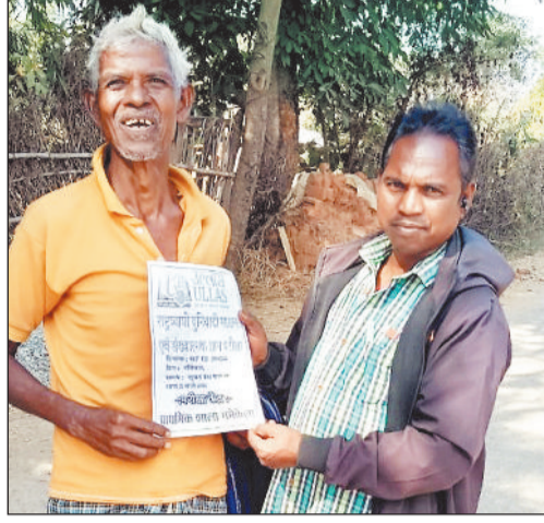
साक्षरता में काम करने वाले लोग घर-घर पहुंचे और उनको निमंत्रण दिया। कहा गया आज उल्लास परीक्षा

शादी-विवाह के साथ अन्य मंगल कार्यक्रमों के लिए कोई निमंत्रण देने पहुंचे तो आश्चर्य नहीं, लेकिन परीक्षा देने के लिए घर-घर न्यौता बांटे तो यह किसी आश्चर्य से कम नहीं। यह नजारा शनिवार को जिले के सभी ब्लॉकों में देखने को मिला। दरअसल आज उल्लास परीक्षा महाभियान है। इसमें जिले के करीब 20 हजार लोग परीक्षा देंगे। इसके लिए शिक्षा विभाग और